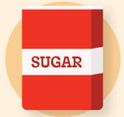
Azúcares de un solo ingrediente usados para cocinar y hornear