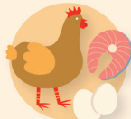
Carne de aves y pescado