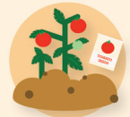
Plantas y frutos secos o semillas