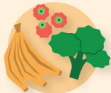
Frutas y vegetales