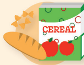
Cereales y pan